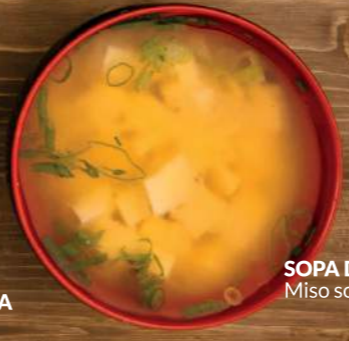
SOPA DE MISO —4,50€ Miso soup 11