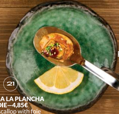
VIEIRA A LA PLANCHA CON FOIE —4,85€ Grilled scallop with foie 21