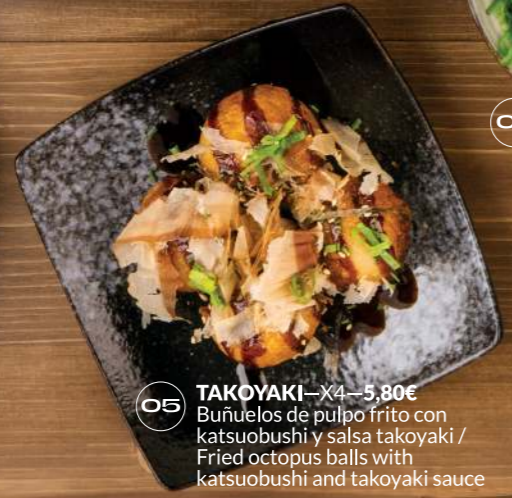
TAKOYAKI —X4—5,80€ Buñuelos de pulpo frito con katsuobushi y salsa takoyaki / Fried octopus balls with katsuobushi and takoyaki sauce 05