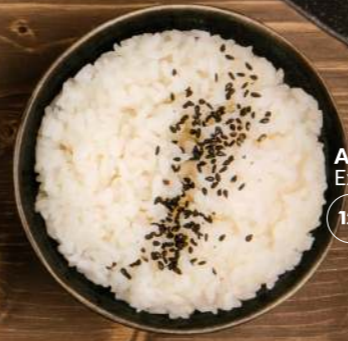
ARROZ BLANCO EXTRA JAPONÉS —3,50€ Extra Japanese white rice 12