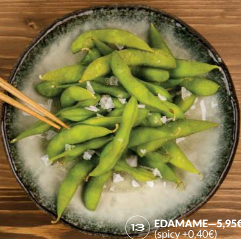
EDAMAME —5,95€ (spicy +0,40€) 13