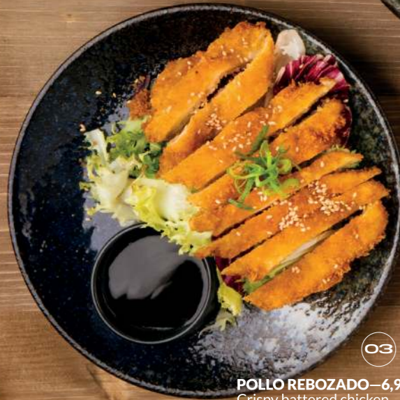
POLLO REBOZADO —6,95€ Crispy battered chicken 03