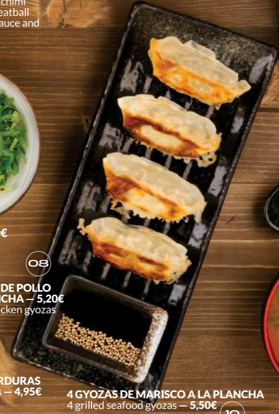
4 GYOZAS DE VERDURAS 4 vegetable gyozas — 4,95€ 09 4 GYOZAS DE MARISCO A LA PLANCHA 4 grilled seafood gyozas — 5,50€ 10