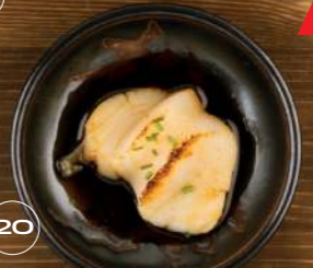
VIEIRA A LA PLANCHA —X2—3,85€ con salsa teriyaki / Grilled scallop with teriyaki sauce 20