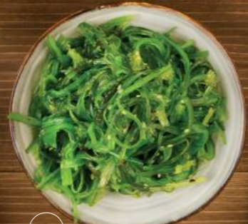
WAKAME —5,50€ 07