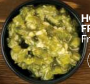
HOJAS DE WASABI FRESCO PICANTE —3,50€ Fresh spicy wasabi leaves 18