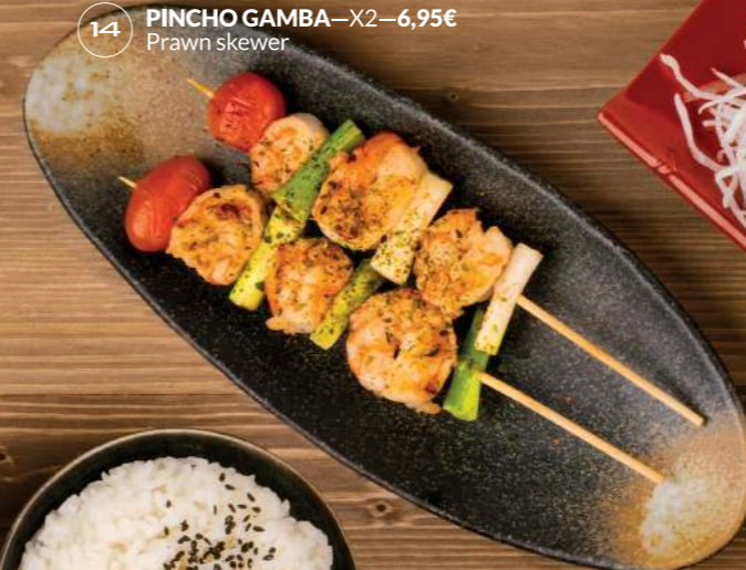
PINCHO GAMBA —X2—6,95€ Prawn skewer 14