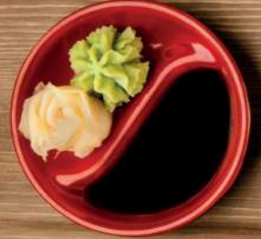
SHAO MAI VAPOR —X4—5,50€ Steamed shao mai 02