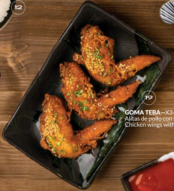
GOMA TEBA —X3—5,85€ Alitas de pollo con sésamo / Chicken wings with sesame 19