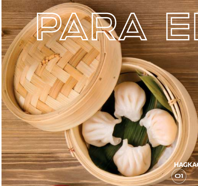
HAGKAO —X4—5,80€ 01