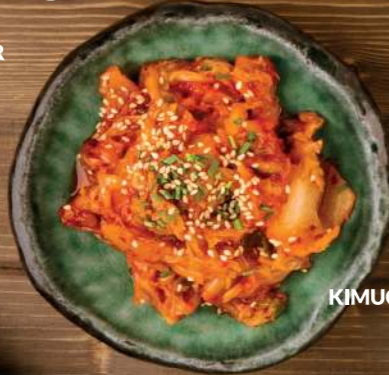
KIMUCHI —5,20€ 04