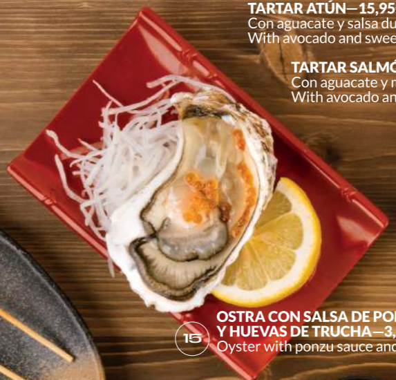
OSTRA CON SALSA DE PONZU Y HUEVAS DE TRUCHA —3,50€ Oyster with ponzu sauce and trout roe 15