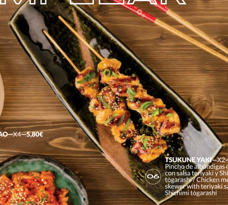
TSUKUNE YAKI —X2—5,95€ Pincho de albóndigas de pollo con salsa teriyaki y Shichimi tōgarashi / Chicken meatball skewer with teriyaki sauce and Shichimi tōgarashi 06